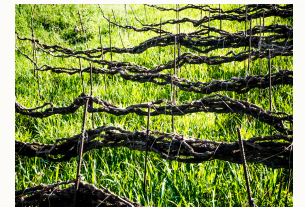
viñas tradicionales de Cordón trenzado