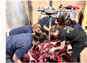
mujeres en fase de elaboración de vino

Lugar: Mercado del Agricultor de la Orotava.